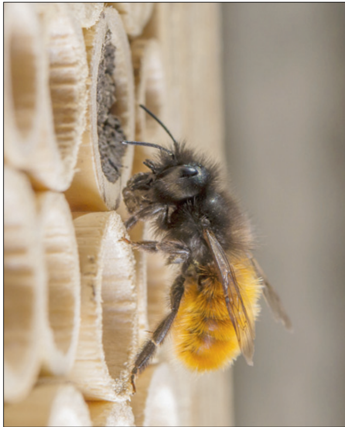
Une abeille observée dans le BeeHome.

Outre les abeilles mellifères, environ 600 espèces d'abeilles sauvages contribuent au miracle quotidien de la pollinisation des cultures vivrières en Suisse et garantissent ainsi l'équilibre des écosystèmes. Pour maintenir cette diversité, Wildbiene + Partner met l'accent sur une stratégie globale pour l'avenir des abeilles sauvages: grâce à un important travail pédagogique et à la création d'habitats pour les abeilles sauvages, l'objectif est de contribuer activement à la multiplication des abeilles sauvages en Suisse et d'ainsi